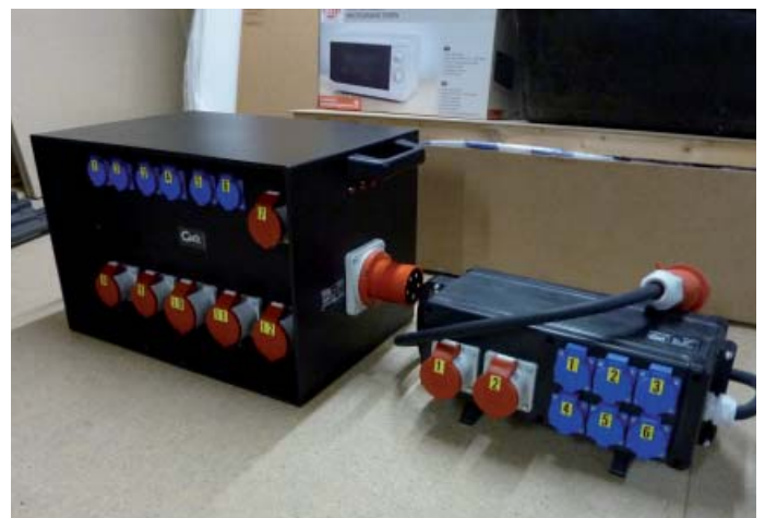
Großer und kleiner Verteilerkasten

gebühren ab 2010 für Vereine und Private 55,00 €, für die Gewerblichen 80,00 €. Damit hoffen wir als Organisatoren zumindest eine „schwarzrote Null“ zu schreiben. Wir kommen damit auch einer Forderung des Stammheimer Bezirksbeirates nach, der eine kostendeckende Einnahmestruktur verlangt hatte. Wir hoffen auf Ihr Verständnis. Teilnehmer, die an der Weihnachtsmarkt-Vorbesprechung anwesend sind, erhalten einen Bonus von 5,00 €