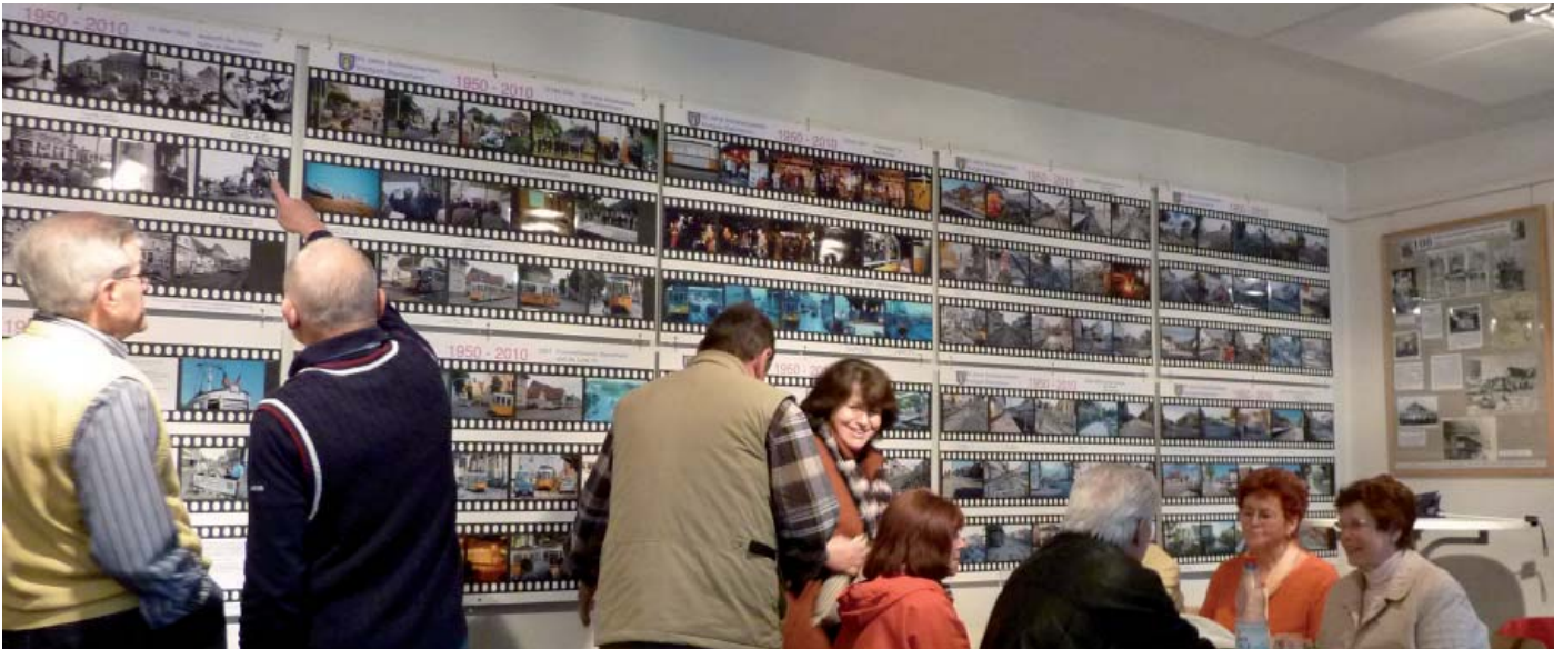
Fotoausstellung im Heimatmuseum Stammheim

Diesen Wandel nachzuzeichnen war unser Ziel, zusammen mit dem Heimatverein Stammheim und dessen Fotoarchiv konnten wir einen interessanten Filmstreifen aus 60 Jahren Schienenanbindung nachzeichnen. Einen breiten Raum darin nehmen die vergangenen Bauarbeiten in der Freihofstraße ein, die das Ortsbild positiv veränderten. Die Ausstellung ist im Heimatmuseum Stammheim, immer am 1. Sonntag im Monat oder nach persönlicher Vereinbarung mit Herrn Motzer, Kornwestheimer Straße 13 zu sehen, Tel. 0711 80 12 29.